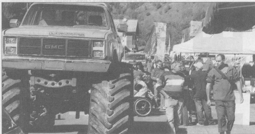
Grâce à ses énormes roues, le "big foot" peut avaler tout ce qui se présente, voitures comprises.

gins, et travaille au perfectionnement de ses véhicules, les rendant toujours plus gros et plus performants. Tant et si bien que l'engin devient une véritable attraction pour le public, et dès 1979, il participe à sa première démonstration payante. En 1981, avec ce qu'on appelle alors le "monster truck", il fait une démonstration dans un stade, roulant sur des voitures "normales" et les écrasant. Une multitude d'imitations font leur apparition au milieu des années 1980, et les premières courses de "monster trucks" se développent aux États-Unis. □